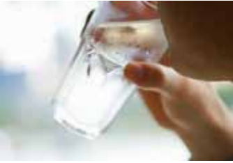
شرب الماء النقي بمعدل مناسب من العادات السليمة