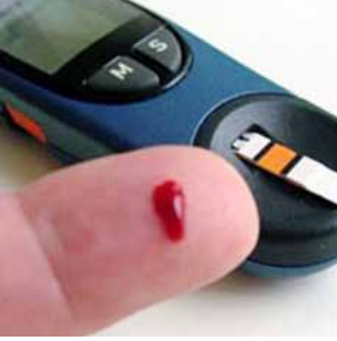
قياس مستوى السكر

بتجنب مضاعفات مرض السكري و ضغط الدم وذلك عن طريق: